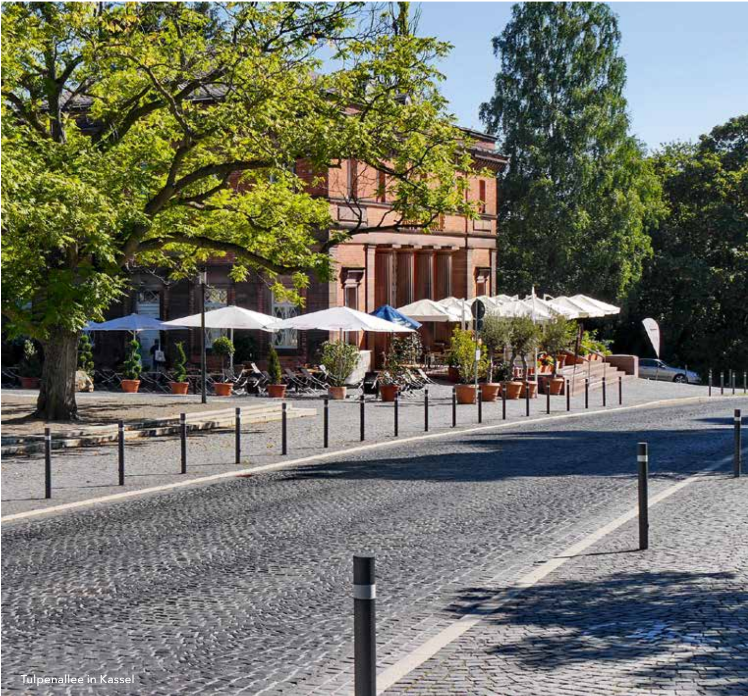
Tulpenallee in Kassel