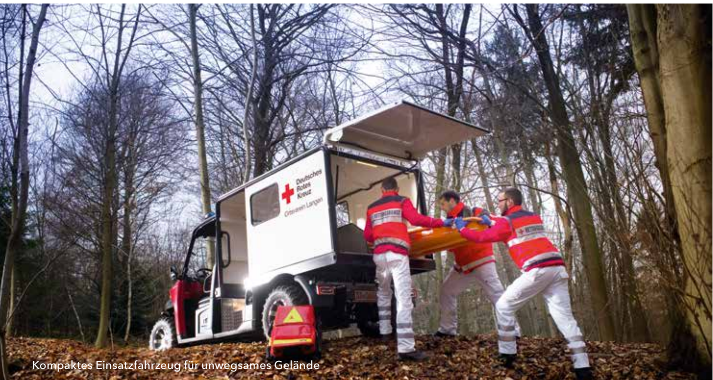
Kompaktes Einsatzfahrzeug für unwegsames Gelände

In der Innovationsstrategie sind die Schlüsselbereiche sowie Handlungsfelder beschrieben, die das größte Potenzial aufweisen, Hessen noch weiter voran zu bringen.