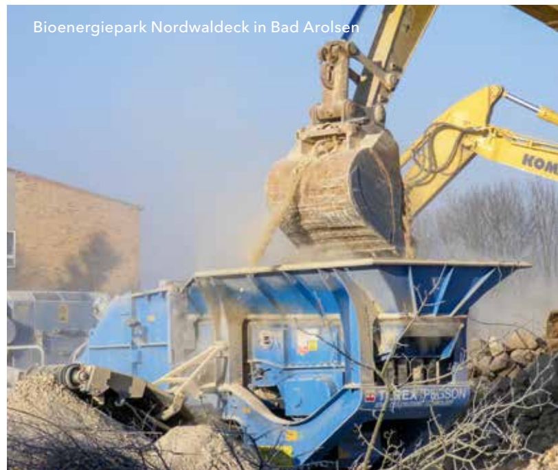
Bioenergiepark Nordwaldeck in Bad Arolsen

Integratives Wachstum – Förderung einer beschäftigungsreichen Wirtschaft, die für soziale und territoriale Kohäsion sorgt