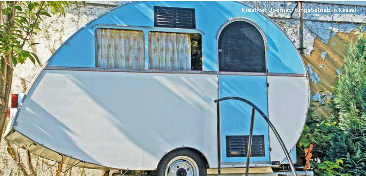
Kreativer Übernachtungsbetrieb in Kassel

Auch die Vermittlung von Wissen rund um das Thema Energie und Ressourceneffizienz sowie die Einrichtung von Beratungsstellen werden gefördert.