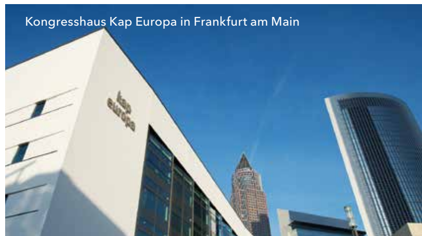
Kongresshaus Kap Europa in Frankfurt am Main

Für die Entwicklung des ländlichen Raums in Hessen stehen aus dem „Europäischen Landwirtschaftsfonds für die Entwicklung des ländlichen Raums (ELER)“ Fördermittel in Höhe von 318,9 Mio. Euro zur Verfügung. Verwaltet wird dieser Fonds im Hessischen Ministerium für Umwelt, Klima, Landwirtschaft und Verbraucherschutz (HMUKLV). Programmschwerpunkte des Entwicklungsplanes für den ländlichen Raum (EPLR) sind die Bereiche: Wettbewerbsfähigkeit der Landwirtschaft, nachhaltige Bewirtschaftung der natürlichen Ressourcen sowie die wirtschaftliche und räumliche Entwicklung der ländlichen Gebiete. Die ELER-Förderung und die EFRE-Förderung ergänzen einander. Eine gleichzeitige Förderung derselben Ausgaben aus EFRE und ELER ist ausgeschlossen.