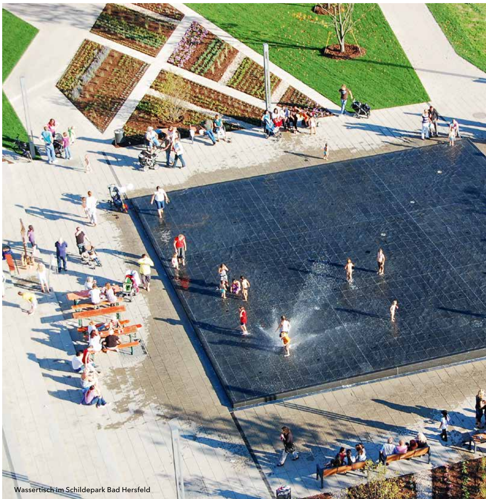
Wassertisch im Schildepark Bad Hersfeld