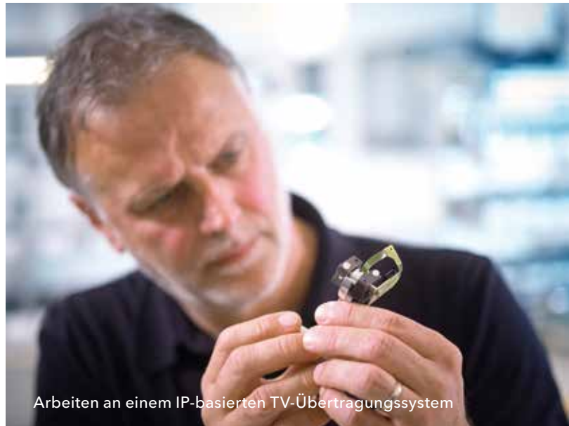
Arbeiten an einem IP-basierten TV-Übertragungssystem

Eine Förderung können Sie zum Beispiel für folgende Vorhaben erhalten: