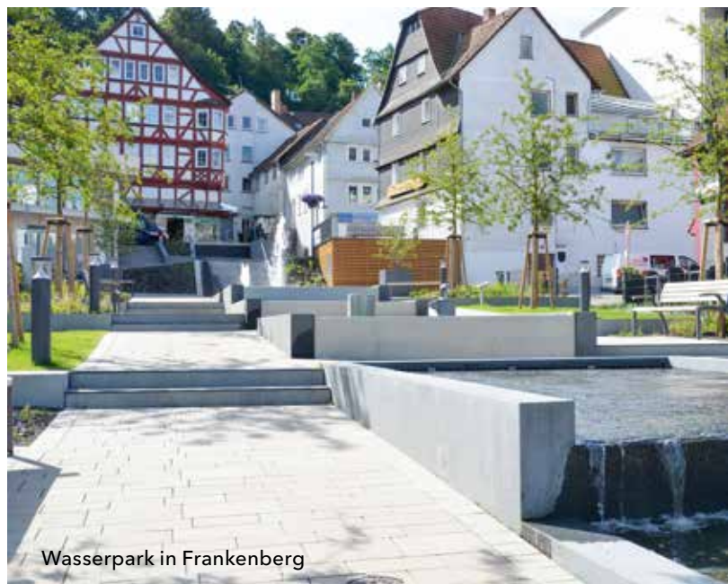
Wasserpark in Frankenberg

Bei Fragen stehen Ihnen die Ansprechpartnerinnen und Ansprechpartner der WIBank gerne zur Verfügung.