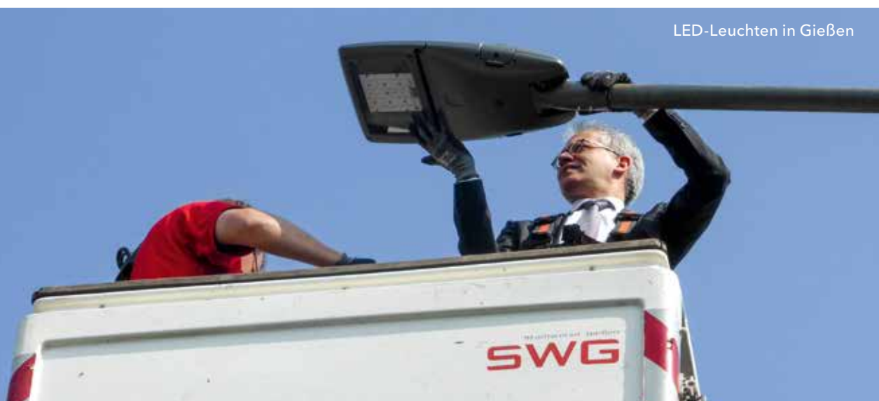
LED-Leuchten in Gießen

Ziel ist eine sichere, umweltschonende, bezahlbare und gesellschaftlich akzeptierte Energieversorgung. Als Zwischenschritt soll erreicht werden, dass Hessen bis zum Jahr 2020 ein Viertel seines Stromverbrauchs aus erneuerbaren Quellen deckt.