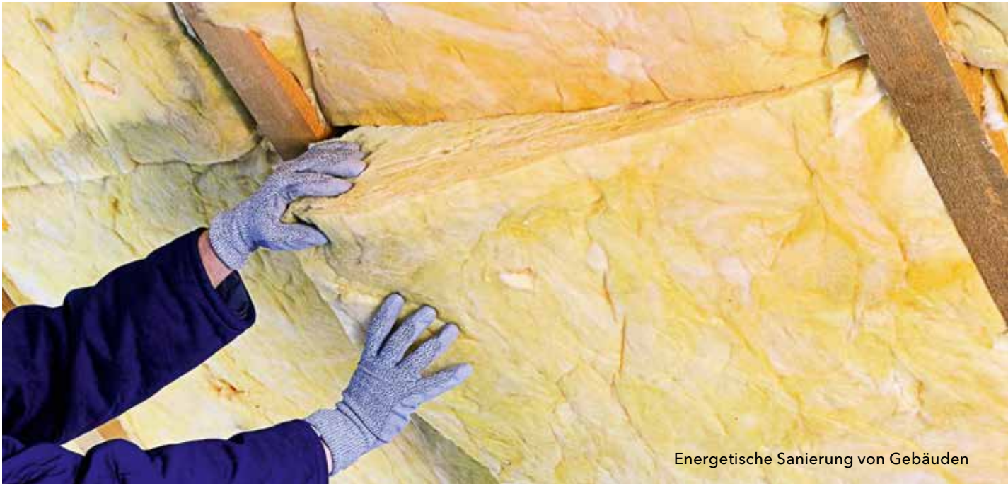
Energetische Sanierung von Gebäuden