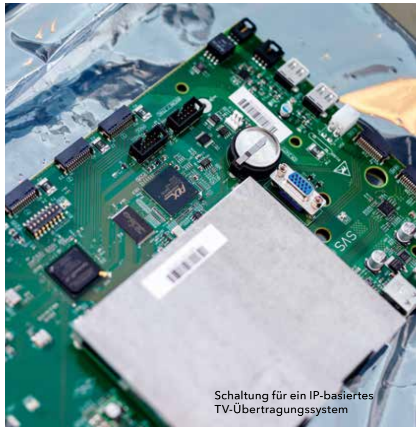
Schaltung für ein IP-basiertes TV-Übertragungssystem

Häufig produzieren und liefern kleine und mittlere Unternehmen einzelne Komponenten größerer Anlagen, am Markt werden jedoch Komplettsysteme nachgefragt. Deshalb ist es ein wichtiges Ziel der Förderung, Kooperationen von kleinen und mittleren Unternehmen untereinander, mit der Wissenschaft sowie Verbundprojekte mit der Industrie zu ermöglichen.