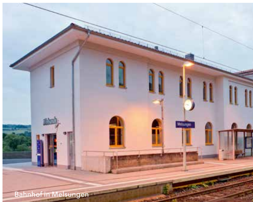
Bahnhof in Melsungen