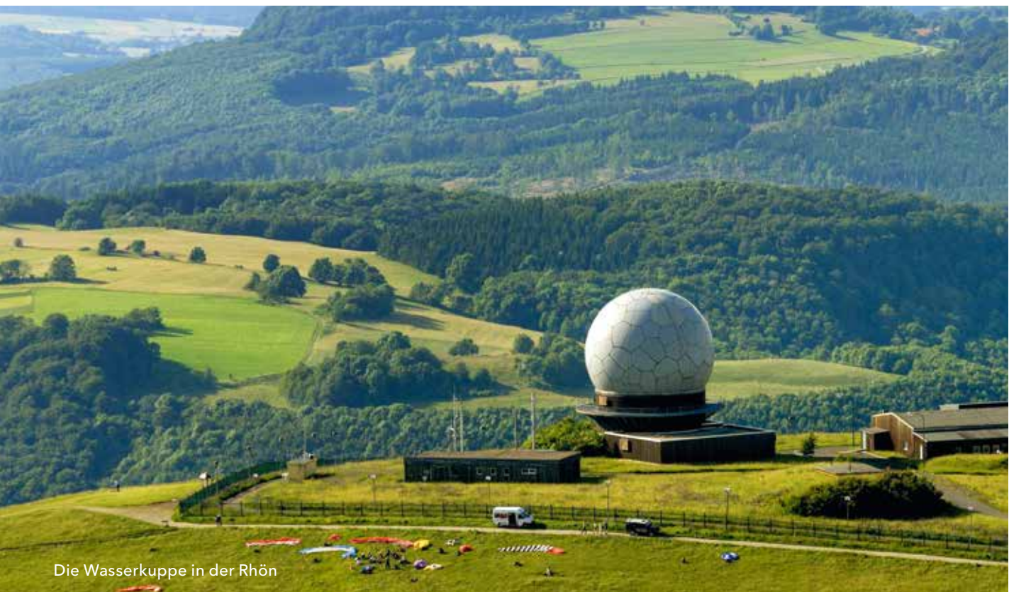
Die Wasserkuppe in der Rhön

Das Zielsystem für das „IWB-EFRE-Programm Hessen“ basiert auf Indikatoren. Abhängig von der Erfüllung dieser Ziele bis Ende 2018 wird dem Programm die leistungsgebundene Reserve in Höhe von 6 Prozent der Mittel einer Investitionspriorität zugewiesen.