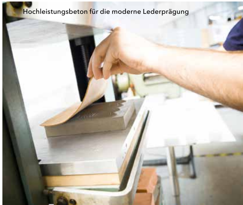
Hochleistungsbeton für die moderne Lederprägung