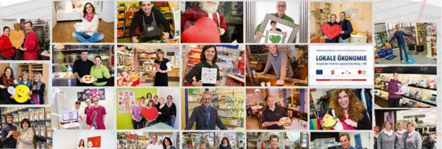
Geförderte Geschäfte in Viernheim

Die Gleichstellung von Männern und Frauen ist eine wichtige Bedingung, um Wachstum, Wettbewerbsfähigkeit und Beschäftigung zu stärken und zur Verwirklichung der Strategie Europa 2020 beizutragen. Deshalb soll der Einsatz der EFRE-Mittel auch dazu beitragen, dass in geeigneten Maßnahmen die Vereinbarkeit von Beruf und Familie für Frauen und Männer gefördert wird, die Frauenerwerbsbeteiligung gesteigert und die berufliche Diskriminierung abgebaut wird. Darüber hinaus soll das Unternehmertum und die Existenzgründung von Frauen gefördert und die Geschlechtergerechtigkeit in den Bereichen Bildung, Forschung und Innovation weiterentwickelt werden.