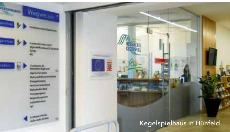
Kegelspielhaus in Hünfeld

Fördergebiet ist ganz Hessen mit den drei Regierungsbezirken Kassel (Nordhessen), Gießen (Mittelhessen) und Darmstadt (Südhessen). Vorrangig sollen die Fördermittel für Projekte in den strukturschwächeren Landesteilen eingesetzt werden. Hierbei handelt es sich um die Regierungsbezirke Kassel und Gießen sowie die Odenwaldregion und die Gemeinde Biblis im Regierungsbezirk Darmstadt. Wesentlich ist jedoch der Beitrag der ausgewählten Maßnahmen zu den im Operationellen Programm verankerten Zielen.