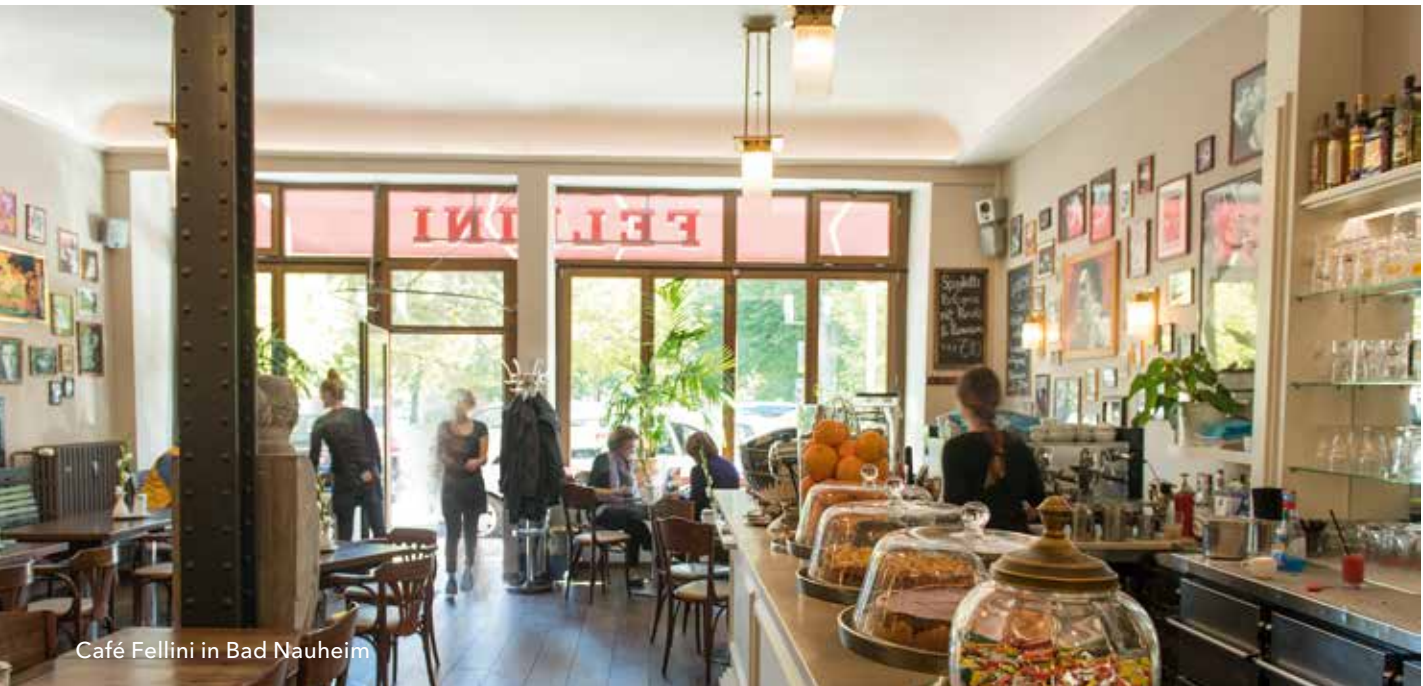
Café Fellini in Bad Nauheim

Die Strategie Europa 2020 wurde im Jahr 2010 vom Europäischen Rat mit dem Ziel verabschiedet, Wachstum und Arbeitsplätze zu schaffen. Sie bildet den innovationspolitischen und strategischen Rahmen der Europäischen Union, um Antworten auf die großen gesellschaftlichen Herausforderungen zu liefern, die sich den europäischen Staaten stellen: